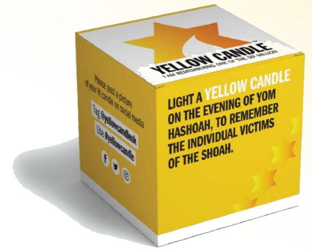
Yellow Candle Box